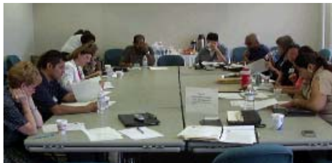
Miembros del Comité Directivo del Centro de Salud de Henry Ford—una de las reuniones mensuales que brindan las organizaciones de la sociedad de REACH.

La sociedad de REACH Detroit se compone de organizaciones que trabajan juntas, para promover estilos de vida saludables en las comunidades de Detroit. El Community Health & Social Services Center (CHASS), Inc., ubicado en el Suroeste de Detroit, es la organización coordinadora central de esta sociedad. Los socios del Comité Directivo incluyen: La University of Michigan Schools of Social Work and Public Health, el Detroit Department of Health and Wellness Promotion, el Michigan Department of Community Health, Southeastern Michigan Diabetes Outreach Network (SEMDON), seis organizaciones basadas en la comunidad (CHASS, Friends of Parkside, Delray United Action Council, Akebulan Village, Southwest Solutions Community Partnership of Southwest Detroit), Henry Ford Health System. Otras organizaciones del vecindario, locales y estatales, contribuyen de manera informal con su experiencia y servicios a través de nuestra Red de REACH-Out.