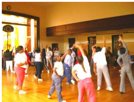
“Una Clase Diferente de Aeróbicos” clase en la Church of the Messiah (Iglesia del Mesías), un Miembro de la Organización del Comité Directivo de REACH Detroit.