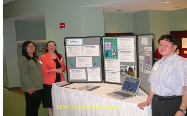
Profesionales de REACH en la comunidad corren la voz, acerca de lo que hacemos.

meses y 12 meses. Muchos participantes de REACH hicieron cambios importantes en sus hábitos. Estos incluyeron el comer mas frutas y vegetales y tomar menos bebidas con sabor a frutas. Ahora, mas participantes toman su dosis recomendada de medicamento, siguen una dieta saludable, checan su nivel de azúcar y sus pies regularmente. Además hubo una importante y saludable mejoría en el nivel de A1C en la sangre, la cual bajó en los participantes de REACH. El A1C mide los niveles de azúcar que hay en la sangre, de los tres meses anteriores. Estamos ansiosos de ver como la salud de los participantes de REACH continúa a mejorar.