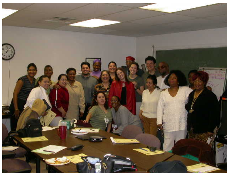
El Personal de REACH Detroit

Promotores de Salud de la Familia para los Latinos y Afro-Americanos (FHA), Facilitadores de la Comunidad y Promotores de Salud de la Comunidad (CHA) – todos pertenecientes a las comunidades de REACH Detroit – están al frente del programa. Los FHAs trabajan directamente con participantes diabéticos, los miembros de su familia y proveedores de salud. Los Facilitadores de la Comunidad y los CHA, trabajan con residentes de la comunidad y otros grupos para aumentar la conciencia de la diabetes, el comer saludablemente y el ejercicio, y para desarrollar programas y servicios. El personal de REACH Detroit desarrolla y a la vez conecta a los residentes de la comunidad con los recursos necesarios para aumentar el ejercicio y el comer saludablemente. Esto incluye clases y grupos de apoyo para la diabetes, comer saludablemente y hacer ejercicio, clubs para caminar, demostraciones de como cocinar comida saludable, jardines comunitarios y mini-mercados de frutas y vegetales.